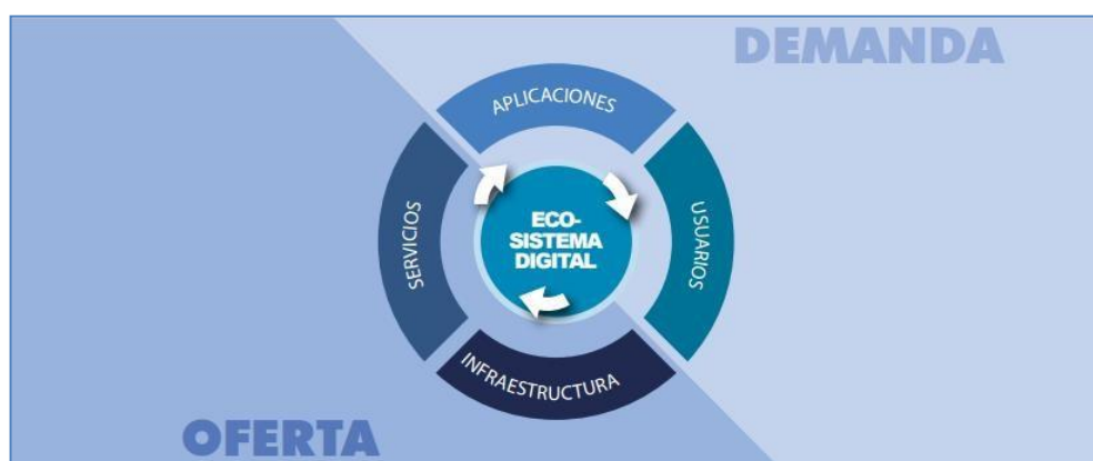
Gráfica 1. Ecosistema Digital

virtuoso en el que existe más demanda de los usuarios, más aplicaciones para éstos, más y mejores servicios a precios más económicos, en una infraestructura moderna” 5 .